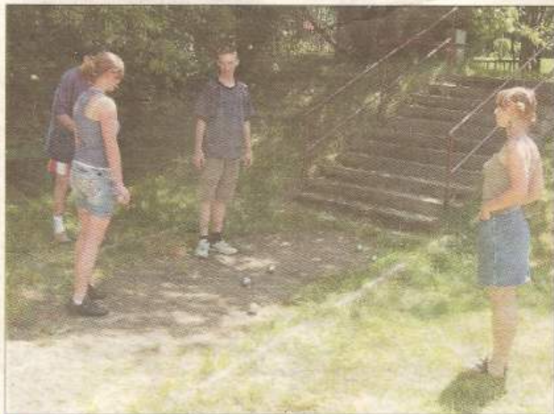
♣ W OSK dzieci uczą się gry w bule