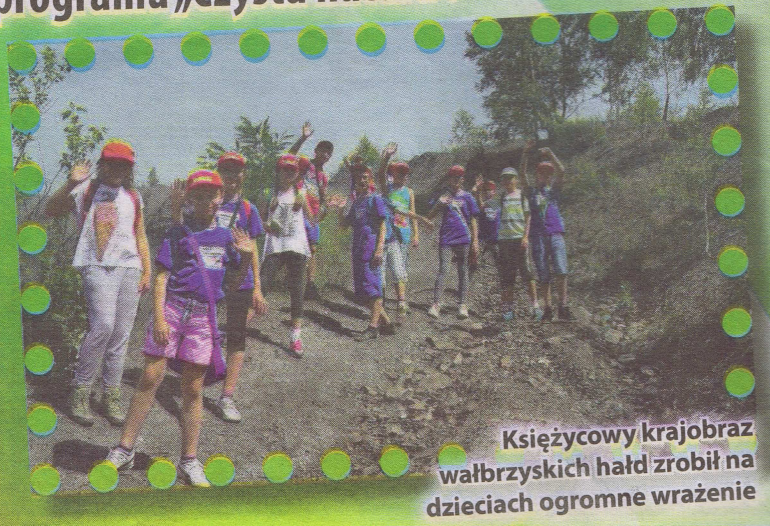
Księżycowy krajobraz wałbrzyskich hałd zrobił na dzieciach ogromne wrażenie

Mieszkańców „Podzamcze” to zabawa połączona ze zdobywaniem wiedzy ekologicznej. Warsztaty, wycieczki, prelekcje multimedialne zorganizowano w ramach realizacji programu „Czysta natura”.