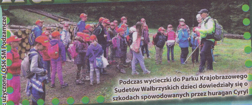
Podczas wycieczki do Parku Krajobrazowego Sudetów Wałbrzyskich dzieci dowiedziały się o szkodach spowodowanych przez huragan Cyryl