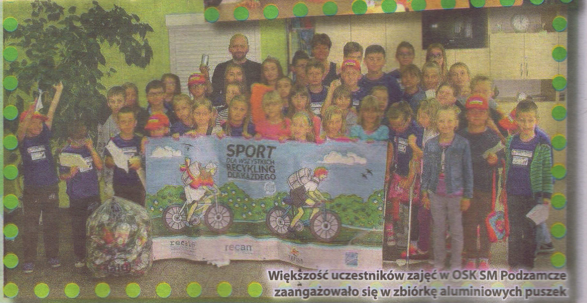
Większość uczestników zajęć w OSK SM Podzamcze zaangażowało się w zbiorke aluminiowych puszek