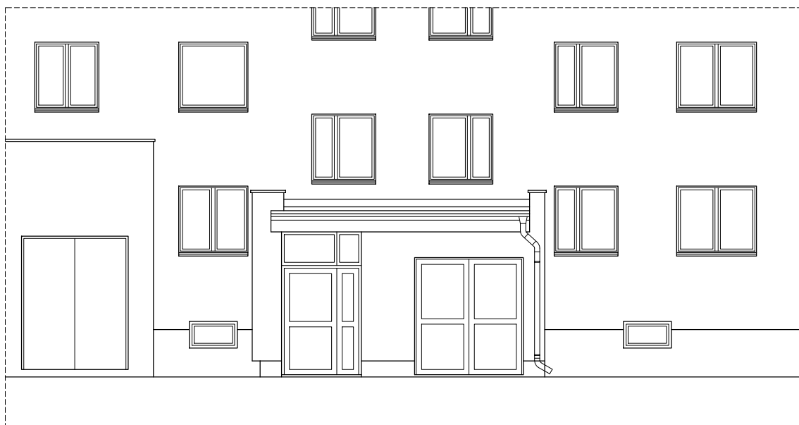
ELEWACJA WEJŚCIOWA - STAN ISTNIEJĄCY