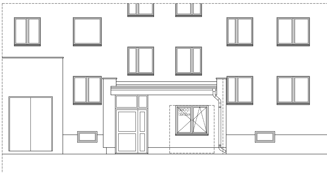
ELEWACJA WEJŚCIOWA - STAN PROJEKTOWANY